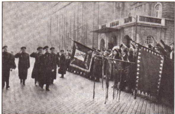
Поздравъ отъ студентитѣ.