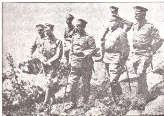
При Първата Свѣтовна война.

"Хиляда години на българска речъ и просвѣта - тѣзи най-трайни и скапи ценности, които непрерывно презъ поколенията ни свързватъ съ оная епоха въ миръ и бури и сътресения, въ величие и упадъкъ, подържаха единството на нашия народъ, повдигаха и крепѣха духа му и вдѣхвайки му надежда, запазиха отъ изчезване неговия здравъ националенъ обликъ".