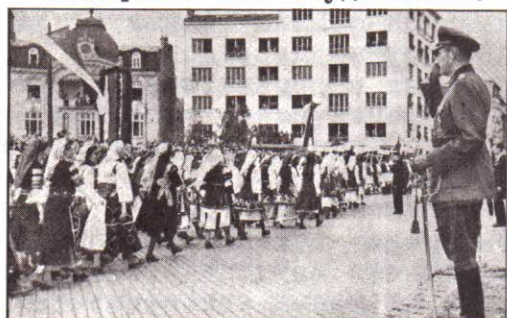
Поздравъ отъ свободна Македония