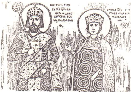
Константинъ Асенъ и Ирина (стенорисъ въ Боянската църква).

Царь Константинъ Асенъ /1257-1277/ билъ до избира-нето му за български царь виденъ боляринъ на име Константинъ Тихъ и ималъ владения край Витоша. Нарекълъ се Асенъ, следъ като се оженилъ за Ирина, внучка на стария Асенъ I. Водилъ продължителни войни съ маджари, византийци, сърби и татари, които не били изгодни за България. При падане отъ конь окупялъ и при едно сражение съ Ивайло падналъ убитъ.