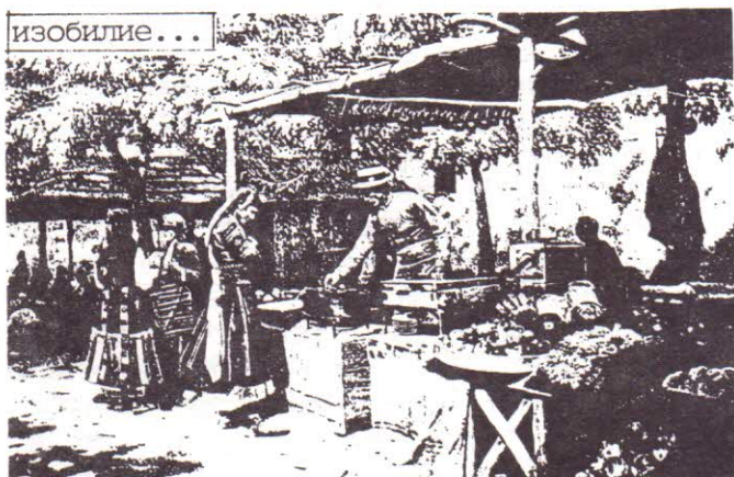
Кебатчийница на пазаря въ Стара Загора

Да се спремъ само на България като наша Родина, съ много живи спомени за хубавото старо време, когато хората се радваха на свободата си, печелѣха добре и сподѣляха щастието си въ фамилия съ многолюдна челядь. Срѣщаха се засмѣни лица, народа се веселѣше, прословутото гостоприемство – характерна черта на българина личеше отъ далечъ и съ готовност всички чакаха праздненства, радостъ и гости. Работѣше само бащата, всѣко семейство имаше две, три и повече деца. Продоволствието никога не бѣше проблемъ. Зимата не минаваше безъ печени прасета, луканки, пържена съдърма и наденици на жарь. Апетитно приготвени пювечи и пълна маса съ мандарини, портокали, смокини и обезателно прѣсенъ пшениченъ хлѣбъ, а за децата вкусни меки питки, кифли и гевреци. Въ най-бедната юлца се месѣха козунаци и боядисваха червени и шарени яйца за Великденъ. Така българскиятъ народъ тачеше свободата си и пестѣше да сюкта нѣщо за деца и старини.