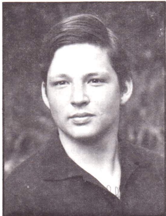
КНЯЗЪ КАРДАМЪ ТЪРНОВСКИ

Ако и да съм далече Аз от тебе, рай земя, Ала никак туй не пречи Ти да ми си все в ума.