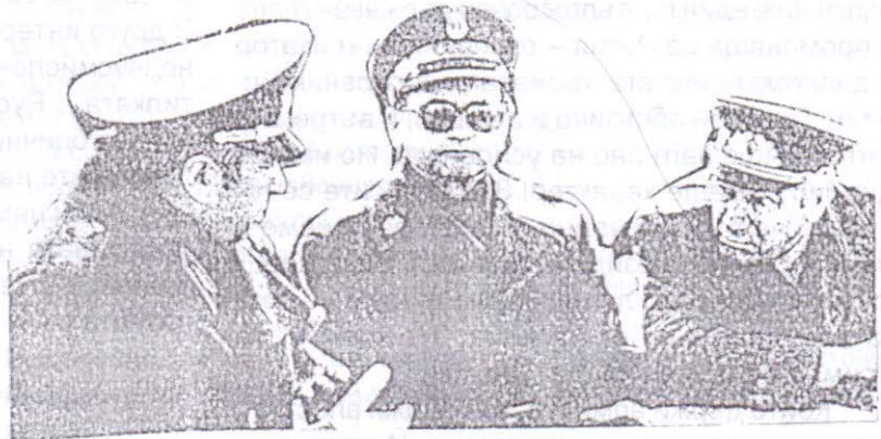
Последното действено ядро на Варшавския военен блок – генералите Ярузелски (в средата), Хофман (вдясно) и маршал Куликов

Справи се блестящо с твърде наивно разиграните политически "водевили" – московския "Пуч" и "арестуването" на М. Горбачов. С тези два акта Борис Елцин подчерта невъзвращаемост-