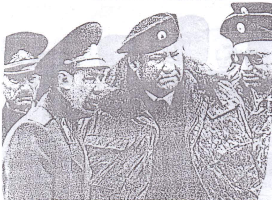
Борис Елцин сред своите генерали

та на нещата в Русия и постави опозицията на колене (лидерите на "опозицията" отдавна бяха купени за дребни пари).