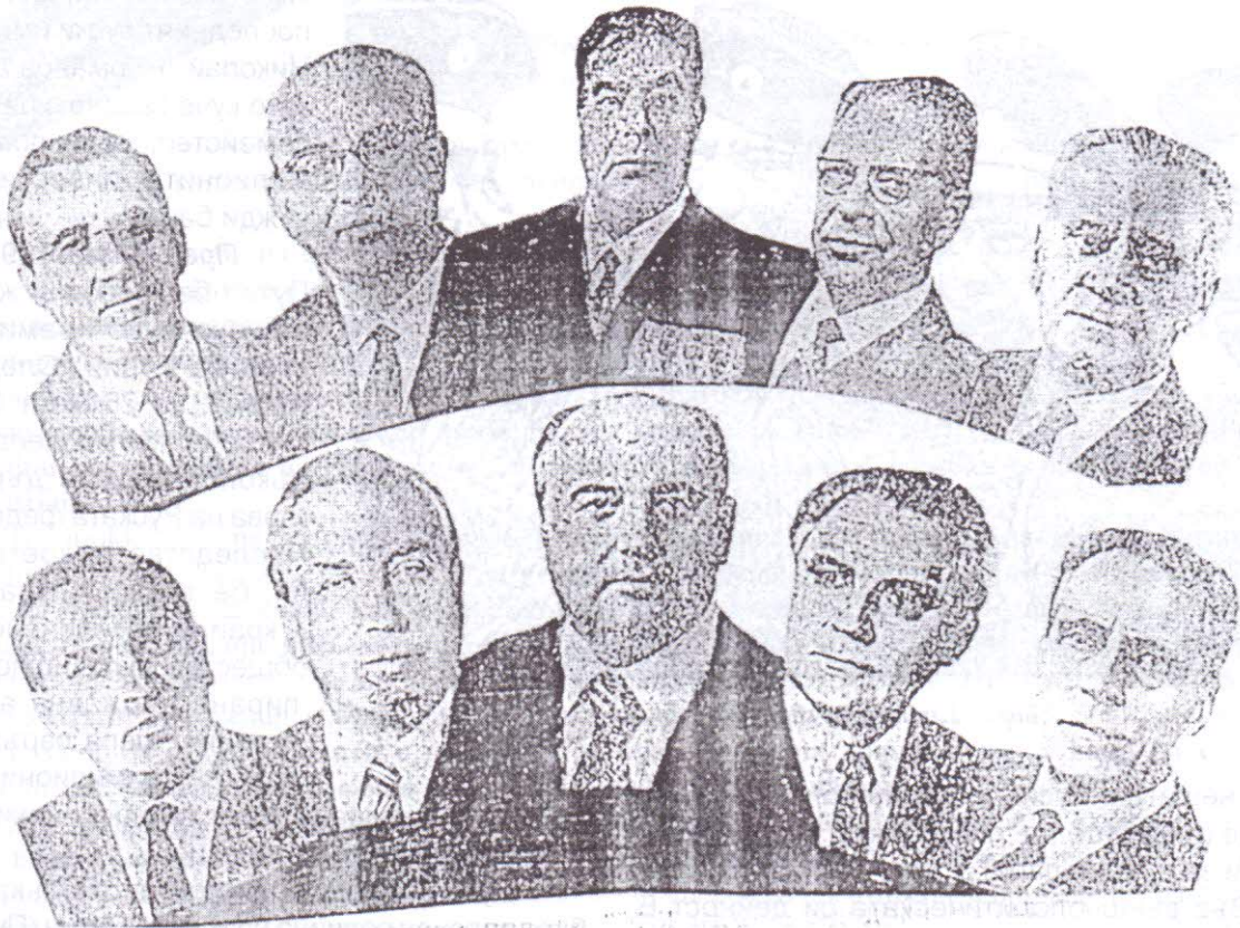
Волю или неволю тези мъже създадоха началото на "перестройката" – беше общо дело (по средата на горния ред – Л. Брежнев, а на долния – М. Горбачов)

След М. Горбачов "перестроечната" щафета бе поета от много добре подготвени и школуван бивш съветски лидер от средния партийен ешелон – Борис Елцин.