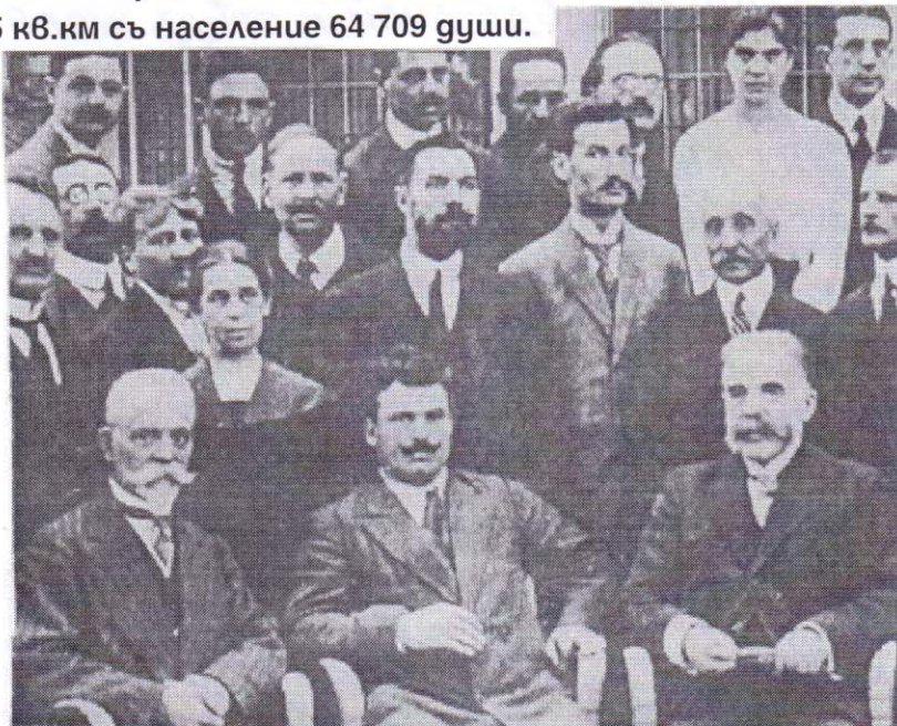
Българската делегация за подписване на Ньойския договоръ. Въ срѣдата е министъръ-председателътъ Александъръ Стамболийски.

По силата на Ньойския миренъ договоръ, подписанъ въ резултатъ на завършилата Първа свѣтвна война отъ България е откъсната територия отъ 1545 кв.км съ население 64 709 души.