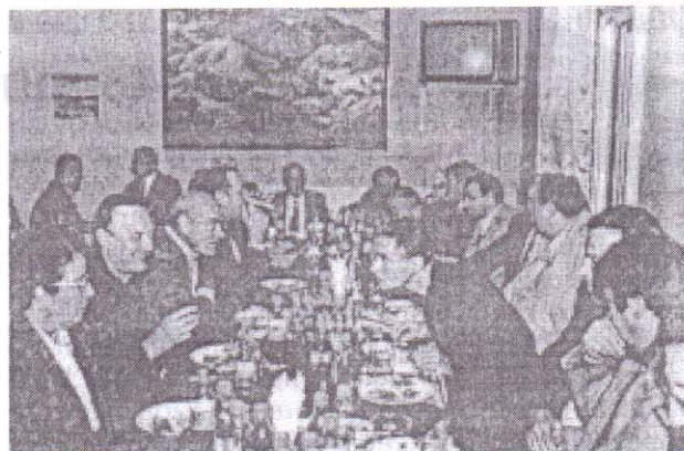
Част от Шести отдел на дружеска среща, 2003 г.

Някои от читателите на сп. “Борба” ще останат недоволни, че списанието, което десетилетия носеше знамето на борбата на българския народ за освобождаването му от веригите на комунизма, днес, в 2006 година, на страниците си дава място на комунистическия форум – 46-ти конгрес. Този конгрес наистина заслужава внимание и ще остане в съзнанието на народа като исторически. Исторически, но не с взетите решения за управленчески действия, целящи подобряване благосъстоянието на хората, а исторически, защото един лидер на партия смъкна маската си на противник на комунизма, а друг изпадна в неблагоприятна ситуация, да бъде подиграван от един професор артист, който в свое интервю казва: “Става въпрос за компромис, който няма да накърни в личен план самочувствието ти и компромис, който няма да те унизи. А когато става въпрос за обществени интереси, националният компромис е задължителен... Сега наистина ми беше приятно като бесепар да видя на трибуната с надпис БСП Симеон Сакскобург-