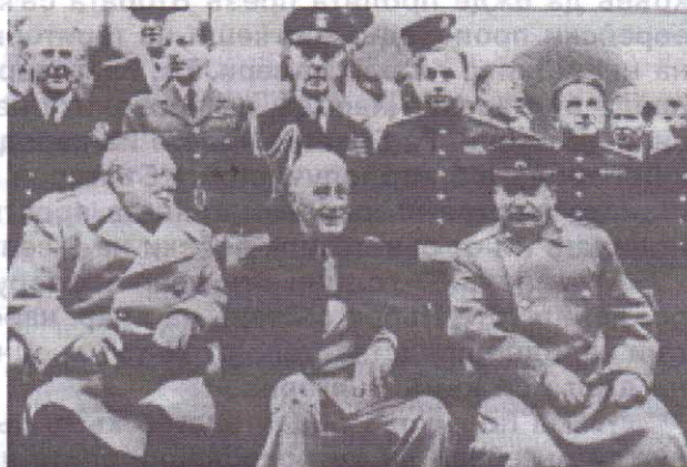
Чърчилъ, Рузвелт и Сталинъ чертаят политическите и икономическите граници на света следъ Втората световна война, Ялта, 1945 г.

Особено внимание на тази среща се отдава за разпределение окупационните зони в победена Германия и сферите на влияние извън нея, които сж неразривно свързани с политически и икономически последиствия за страните, попаднали в тези зони. Безъ тези договорености дори и гротътът на войната да е секналъ, военните