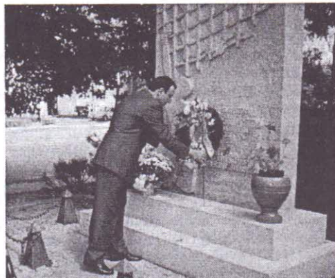
Президентътъ Петъръ Стояновъ поставя вѣнецъ предъ паметника на жертвитѣ на комунизма въ Ниагара Фалсъ, Канада

Всѣка година презъ месецъ май българската национална емиграция се събира предъ паметника въ Ниагара Фалсъ, отслужва се молебенъ, извършва се поклонение и се полагатъ цвѣтя.