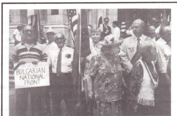
На 20 юлий 1997 г. въ Ню Йоркъ се е състояла манифестация противъ комунизма за освобождение на още поробенитѣ народи, по случай Седмицата на Поробенитѣ отъ комунизма. БНФ въ Ню Йоркъ е взелъ участие въ манифестацията. На снимката групата отъ БНФ предъ църквата „Св. Патрикъ“, Ню Йоркъ.