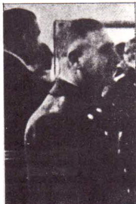
Генералъ Никола Миховъ Убитъ на 2 II 1944