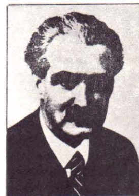
Димитър Гичевъ починалъ следъ затворитѣ си на 15 VIII 1958