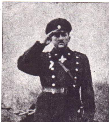
Князь Кирилъ Преславски Убитъ на 2 II 1944