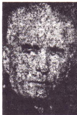
Коста Муравиевъ Умрял отъ затвора. 18 V 1965