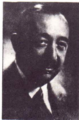
Проф. Богданъ Филовъ Убитъ на 2 II 1944