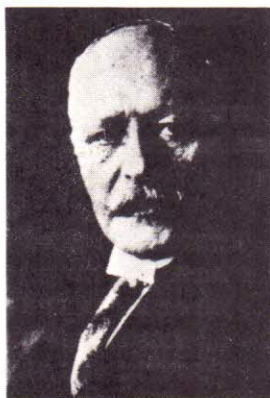
Никола Мушановъ Умрял въ затвора 27 V 1951