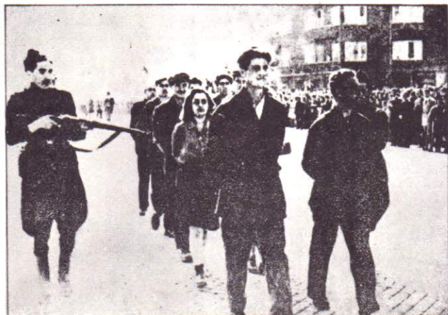
ГРУПА ЛЕГИОНЕРИ ОТЪ СОФИЯ, СЪ ВЪРЗАНИ ОТЗАДЪ РЪЦЕ ОХРАНЯВАНИ ОТЪ МИЛИЦИОНЕРИ-ПАРТИЗАНИ ОТИВАТЪ НА РАЗСТРЕЛЪ НА 19 IX 1944 СЪ ГОРДО ВДИГНАТИ ГЛАВИ И СЪ УСМИВКА НА УСТА ЗАЩОТО ЗНАЕХА, ЧЕ УМИРАТЪ ЗА БЪЛГАРИЯ.