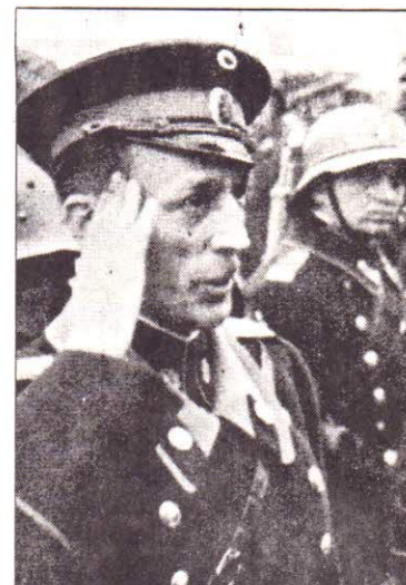
Христо Добриновъ убитъ въ София на 9 IX 1944