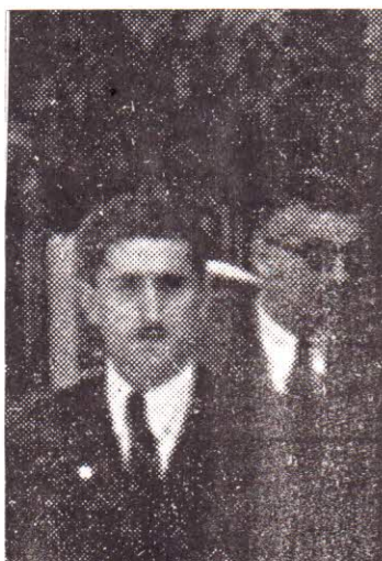
Климентъ Далкалъчевъ убитъ въ София на 9 IX 1944