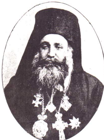
Митрополитъ Борисъ убитъ въ църквата въ Петричъ на 11 VIII 1948