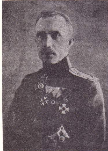
Генералъ Иванъ Вълковъ умрѣлъ въ Бѣлене 1958 на 84 годишна възраст