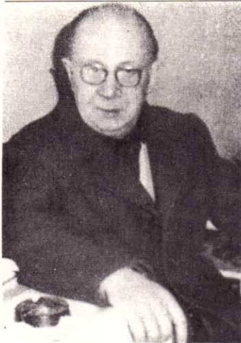
Проф.Д-ръ Гаданъ Сарафовъ Разстрелянъ на 5 VII 1968