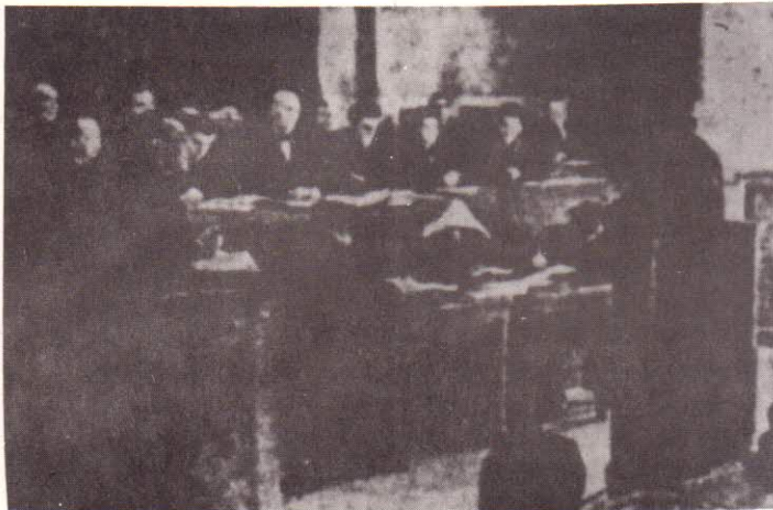
Митрополитъ Николай слуша смъртната си присѣда Разстрелянъ на 14 III 1945