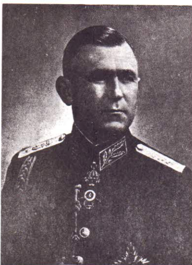
Генералъ Теодосий Даскаловъ Убитъ на 2 II 1945