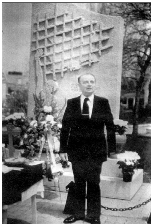
Пред паметника на жертвите на комунизма в Ниагара Фалс – 1983 г.

Въпреки присъствието на Червената армия, която контролираше положението в страната, комунистите не се чувстваха сигурни, защото ня-