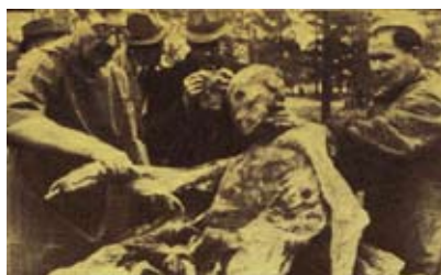
Този труп е “съблечен” от лекарите. Документите му от униформата са взети и се разглежда от пражките професори Хажек и Субик и от председателя на полския Червен кръст д-р Ведцински. Той казал: “Най-отдолу са лежали подпоручиците, а най-отгоре – генералите.

Потвърждават се и снимките и обясненията на военния дописник Ханс Хубман на сп. “Сигнал”, кн. 12 от юни 1943 г., поместени под заглавие “Документ Катин”.