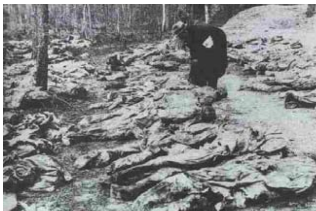
Проф. д-р Навил – Женева, познава полската военна униформа. Така се установява националността на жертвите.

Понеже нямал покана от Съветския съюз, Международният Червен кръст отказва участие в разследването. “Затова германците предприеха собствено разследване и комитетът от специалисти, събрани от гържави под контрола на Германия, излязоха