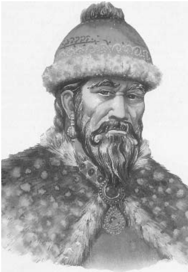
Ханъ Крумъ (803-814)

държавенъ и общественъ служителъ да бжде осъденъ на смъртъ, когато се улови въ кражба, подкупъ, клевета и интрига. ” Съ това той показва, че не се двоуми да постави разпоредителитѣ съ властѣта на най-сурово санкциониране предъ другитѣ граждани при извършване на закононарушение, за което обикновенитѣ граждани се наказватъ по-мекко. Специаленъ законъ за укривателство на престъпницитѣ, въ това число и отъ държавни служители, санкционира укривателя съ конфискуване на имотитѣ му въ полза на хазната. За частни случаи на кражба отъ неслужебно лице законитѣ предвиждали рѣзване на рѣце и чупене на колѣне, а за извършена отъ служебно лице, както е предвидено въ другъ законъ – смъртъ. Дѣло на хана е и законътъ за пиянството, въ което той знаково е виждалъ упадъка на нравитѣ и пѣтъ къмъ закононарушения. Общо съ законодателството си той е искалъ не само да внесе порѣдъкъ въ застрашенитѣ обществени отношения, но и да ги утвърди като дългосрочни правила за поведение, безъ които всѣко общество и държава върви къмъ своята гибель.