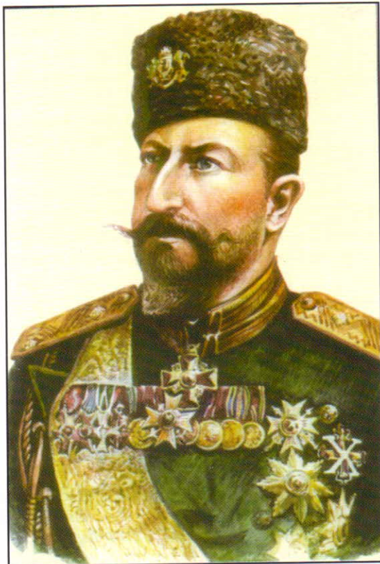
Царь Фердинандъ I 1887–1918

На 6 септември 1885 г. осъществи Съединението на Източна Румелия съ Княжество България