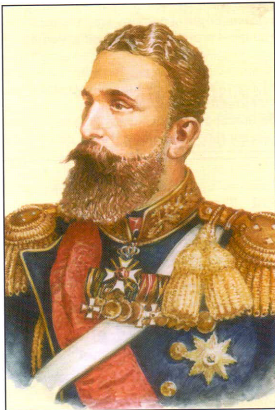
Князь Александъръ I 1879–1886

Поклонъ! Съ дълбока почитъ и благодарностъ къмъ строителитѣ на независима България!